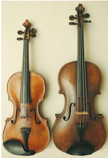
Fiol och Altfiol (lägg märke till storlekskillnaden)